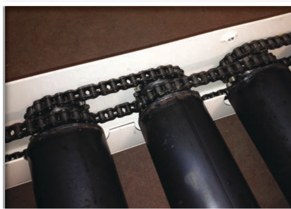
Transmission par chaînes bracelets